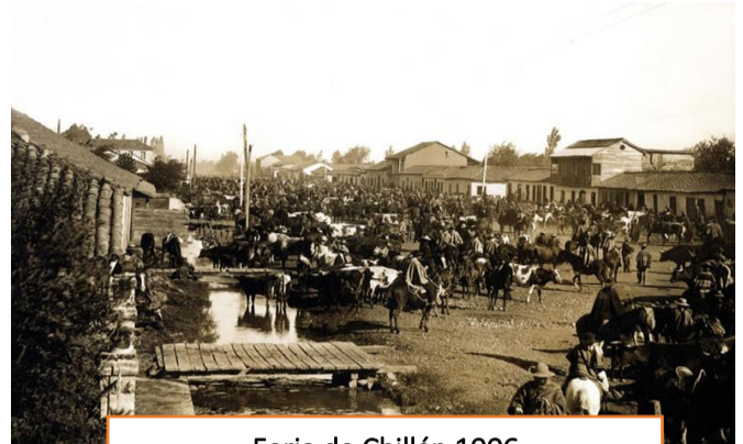
Feria de Chillán 1906