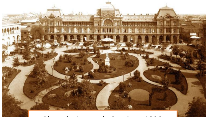
Plaza de Armas de Santiago 1890

El paso del siglo XIX al siglo XX, implicó cambios, pero también muchos aspectos permanecieron. La ciudad de Santiago de 1910, por ejemplo, no era muy distinta a la de 1870, sin embargo, el progreso económico, alcanzado a través de la actividad salitrera, permitirá la llegada de la modernidad a nuestra ciudad y país. Modernidad que se ve reflejada, en las construcciones arquitectónicas de estilo francés, como la Estación Central y Estación Mapocho, el palacio de Bellas Artes, entre otros. La panorámica en regiones, era absolutamente distinta, las ciudades, no tenían sistema de agua potable y alcantarillado, generando una mirada antagónica al progreso evidenciado en el centro del país.