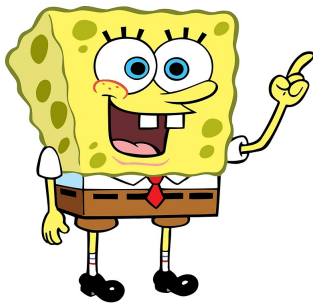
Tabla de Logros

Así tu profesora con tiempo, podrá despejar tus dudas y entregar una oportuna retroalimentación.