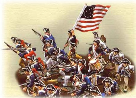
Independencia de Estados Unidos

Será así como la ilustración desencadenará una serie de procesos revolucionarios, que transformarán de forma radical la vida de los hombres y mujeres de la sociedad.