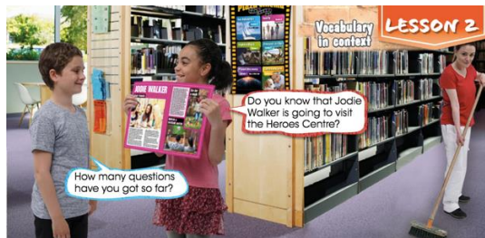
(Imagen referencial de foto en página 17)