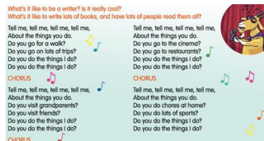
(Imagen referencial de letra en página 17)