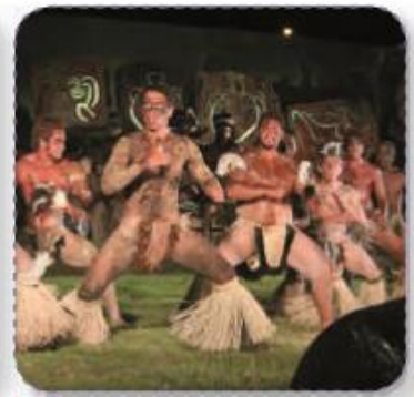
⬆ Tapati Rapa Nui