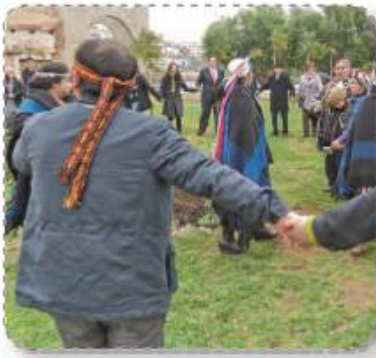
⬆ We Tripantu