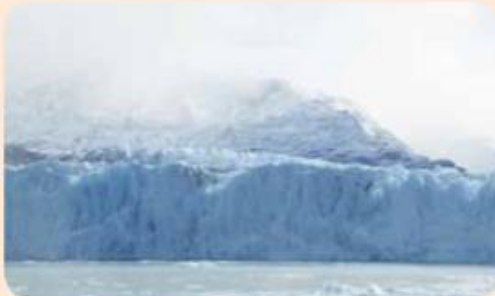
▲ Laguna San Rafael.