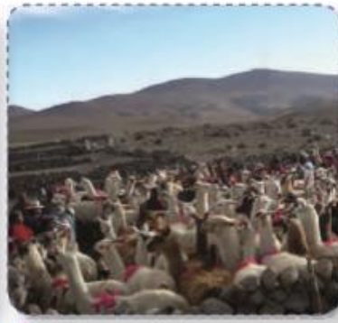
⬆ Floreo de llamas