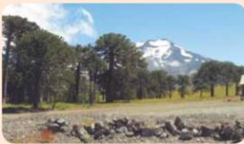
▲ Volcán Lonquimay.