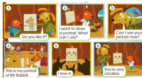
(Imagen referencial del libro)

What Does Squirrel use for the portrait? ¿Qué utiliza la ardilla para el retrato?