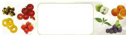
(Imagen referencial del libro)