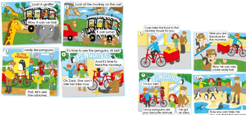
(Imagen referencial del libro)