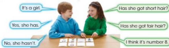
(Imagen referencial del libro)