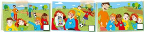
(Imagen referencial del libro)

2. Observa las imágenes, en cada una de ellas escucharás una conversación y mientras escuchas atentamente enumera los casilleros del n°1 al 3