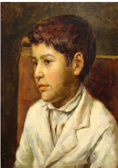
El Niño de la chaqueta blanca Autor: Cosme San Martín

Observa atentamente los retratos y escenas con niños de los escultores chilenos Cosme San Martín y Pedro Lira.