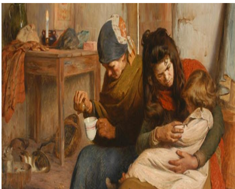
Niño enfermo Autor: Pedro Lira