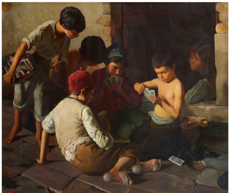
Brisca Autor: Cosme San Martín