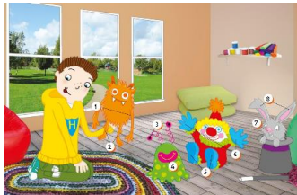
(Imagen referencial del libro)

Before starting work watch the following video (one little finger) antes de comenzar a trabajar vea el siguiente video ( Un dedo pequeño) , recuerda que aquí encontrarás todos los videos y audios https://englishdepartmentcsj.wixsite.com/english