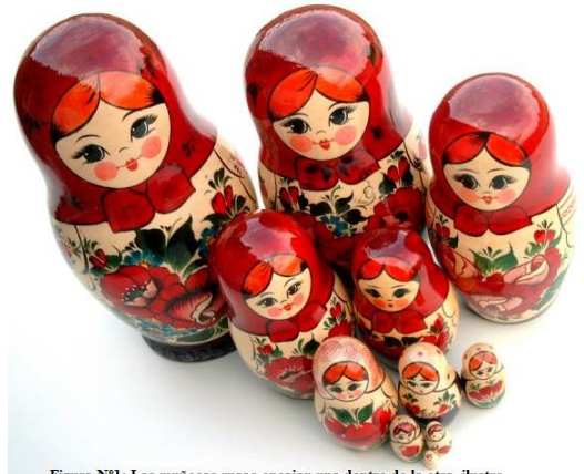
Figura N°1: Las muñecas rusas encajan una dentro de la otra, ilustra como los niveles de organización engloban al anterior

Los niveles de organización pueden definirse en una escala de organización que sigue el criterio de menor a mayor complejidad, de menor a mayor organización. Para que comprendamos lo que es un nivel de organización pensemos las muñecas rusas (katiuskas) y como encajan una dentro de la otra, desde la más pequeña a la más grande, así se organizan los niveles de organización de los seres vivos: van desde la organización más simple hasta la más compleja. Nos encontramos con los siguientes niveles ecológicos: