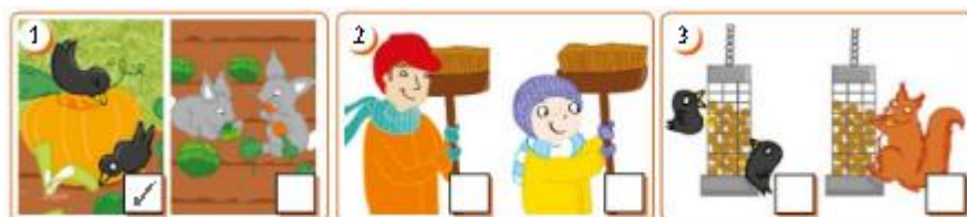
(Imagen referencial del libro)

1. Mirar los tres recuadros con dibujos, observar y hacer un ticket en la imagen correcta de cada recuadro de acuerdo a la historia.