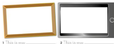
1 This is my _____ 2 This is my _____

1. Observa los dos marcos de fotos, imagina a quien te gustaría dibujar en ellos, escoge dos miembros de tu familia. 2. Ahora que están dibujados y pintados, debes completar las frases.