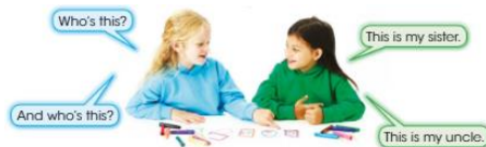
(imagen referencial del libro)

1. Pedir al niño/a observar la imagen y escuchar la grabación dos veces 2. Volver a poner la grabación y parar en cada frase para que el alumno/a se anime a repetir las frases.