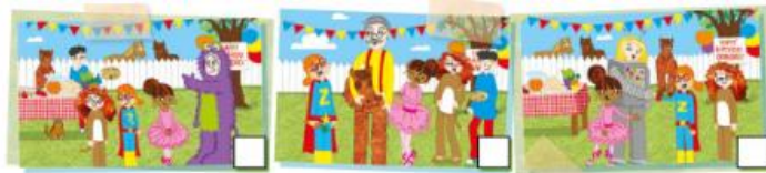
(Imagen referencial del libro)

2. Observa las imágenes, en cada una de ellas escucharás una conversación y mientras escuchas atentamente enumera los casilleros del n°1 al 3