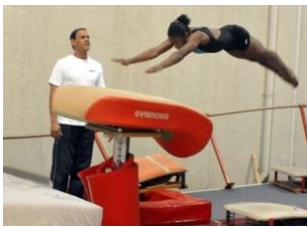
Salto de caballete