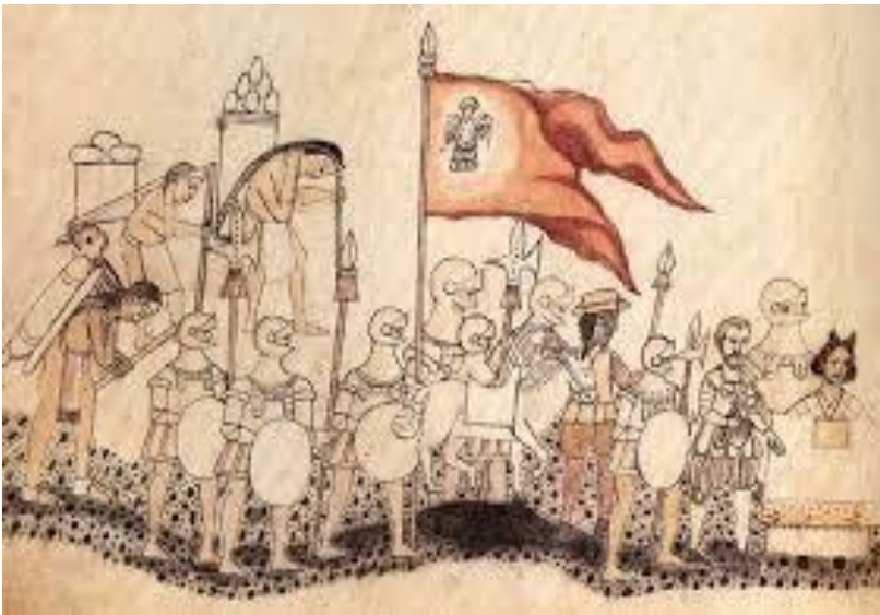
Imagen del código Azcatitlan (ca.1550-1600). En ella se muestra la hueste de Hernán Cortés.

El Códice Azcatitlan, creado en el siglo XVII, trata de la historia mexicana antes de la llegada de los españoles hasta el periodo de la conquista y colonización. "Los códices son fuentes históricas de primera mano en los que las sociedades indígenas, por intermedio de escribas con la habilidad para pintar con gran maestría, dejaron constancia fiel de sus logros y avances culturales y científicos e informaron sobre una multitud de aspectos, como las creencias religiosas, los ritos y ceremonias, la historia, el sistema económico y la cronología, entre muchos otros".