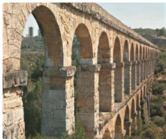
Acueducto construido por los romanos en el siglo I antes de Cristo en Tarragona, actual España.

Actividad 2: Responde las preguntas en tu cuaderno.