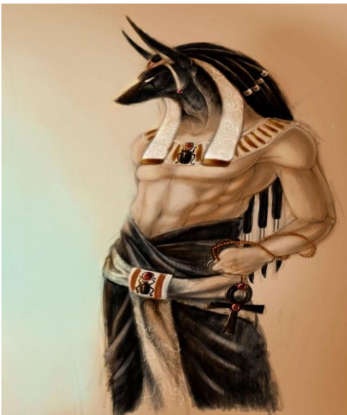
Dios Egipcio de la Muerte Anubis