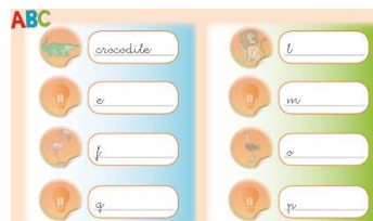
(Imagen referencial del libro)