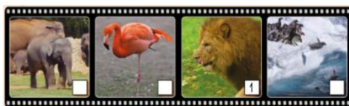
(Imagen referencial del libro)