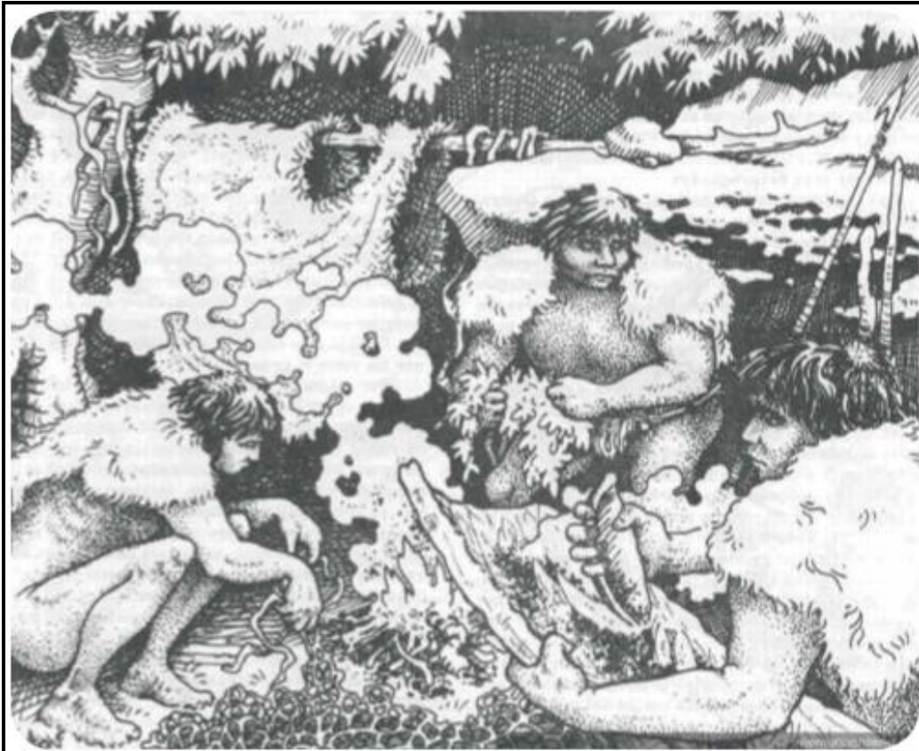
▲ Chonos: Confección de redes con cueros sin curtir. En: Chiloé: Revista de divulgación del Centro Chilote (1988).

Actividad 1: Observa la imagen del pueblo chono y pinta de color café las pieles que encuentres y de color rojo con amarillo el fuego.