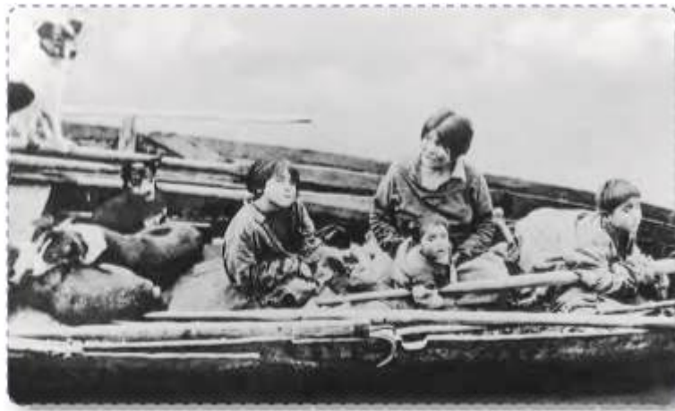
➔ Familia alacalufe en una canoa

Confeccionaban sus vestimentas con grasa de lobos marinos y pieles para protegerse de las bajas temperaturas.