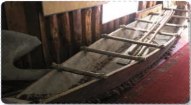
➤ Dalcas utilizadas por los chonos