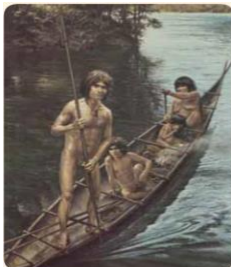
▲ Familia yagán en su anan.

Los yaganes mantenían una pequeña fogata en el anan, para poder viajar en las noches y protegerse del frío.