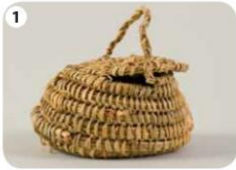
▲ Cesta perteneciente al pueblo yagán.

Actividad 2: Observa las siguientes imágenes pertenecientes a objetos confeccionados por el pueblo yagán y completa el recuadro.