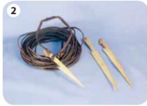
▲ Arpones confeccionados con huesos por el pueblo yagán.