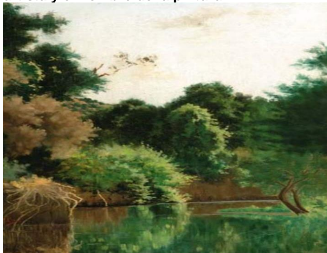
Estero Manso de Pedro Lira

Observar atentamente las siguientes obras del artista chileno Pedro Lira. Puedes buscar en internet las imágenes para poder observar en vivo sus colores. Para esto debes usar Google imágenes y colocar los nombres del artista y el nombre de la pintura.