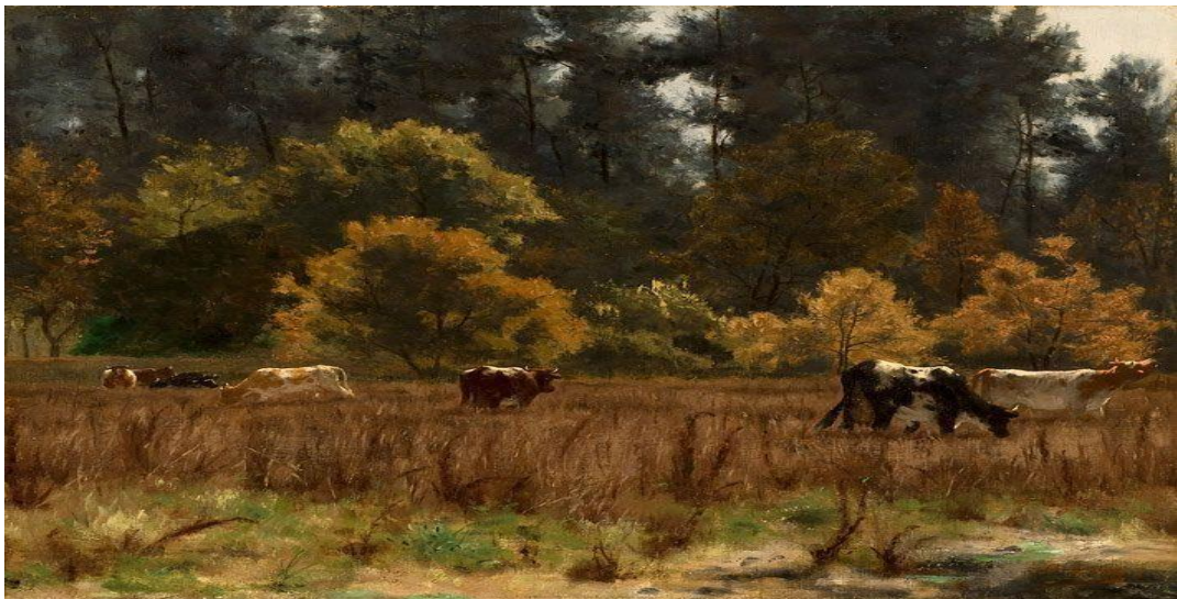
Animales pastando de Pedro Lira