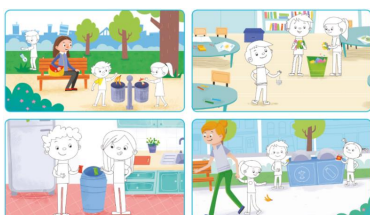
(Imagen referencial del libro)