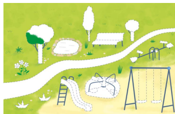
(Imagen referencial del libro)