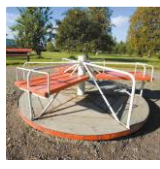
MERRY GO ROUND