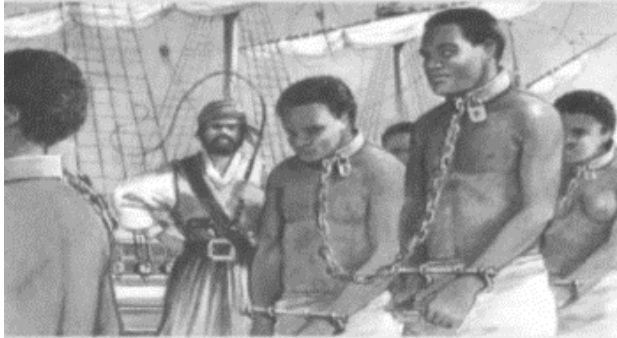
Eltis David, The Rise of African slavery in the Americas , Cambridge, University Press, 2000.

El declive continuado de la población amerindia a lo largo de todo el siglo XVI y el siglo XVII, que en algunos casos llegó a suponer la desaparición de más del 70% de la población, sobre todo en las zonas de clima caliente como el Caribe, permitió que el movimiento esclavista, como afirma Rina Cáceres, fuera revertido de África a tierras americanas. Las rutas de ingreso de este tráfico humano fueron múltiples, pero hay que distinguir entre centros de empleo masivo, verbigracia minería del oro y plantaciones, y de redistribución, donde estaría el caso de Cartagena de Indias. Los puntos de entrada se extendieron a lo largo de todas las costas americanas y en especial las del mar Caribe. Los estudiosos de la trata interoceánica han señalado que los hombres africanos esclavizados salieron de cuatro regiones principalmente y sus respectivos puertos, que fueron cambiando al mismo tiempo que los actores de la trata, portugueses, holandeses, ingleses y por último franceses: la costa del oro, la bahía de Benin, la bahía de Biafra y el África centro occidental.