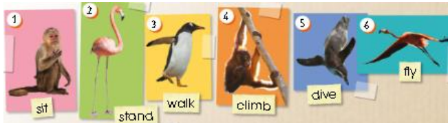
(Imagen referencial del libro)