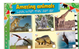
(Imagen referencial del libro)

It can stand and eat leaves from the tops of trees.