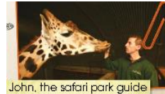
(Imagen referencial del libro)