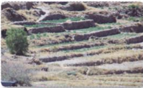
➤ Terrazas de cultivo

Los hombres y las mujeres aymaras se dedicaban al pastoreo (alpacas y llamas) , la producción textil y el cultivo de maíz, papas, porotos y quínoa. Sus casas eran de piedra y barro , se llamaban uta y no tenían ventanas porque así se protegían del frío y hablaban la lengua aymara .