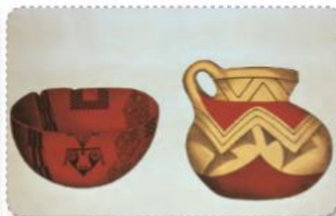
➤ Vasijas de alfarería atacameña

Ve los siguientes videos de la serie chilena para niños "Pichintun" de niños aymaras y atacameños.