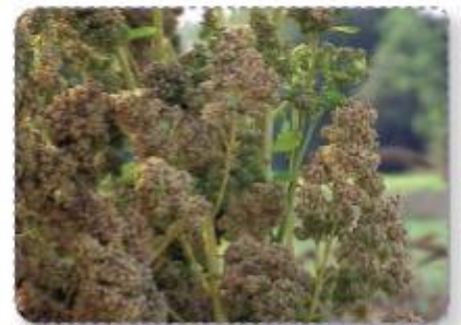
➤ Cultivo de quínoa