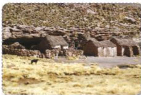
➤ Machuca, poblado atacameño

Los atacameños o likanantai se dedicaban a la alfarería, producción textil, la ganadería y la agricultura. Sus casas eran de barro con graneros en el techo y su lengua era la kunza .