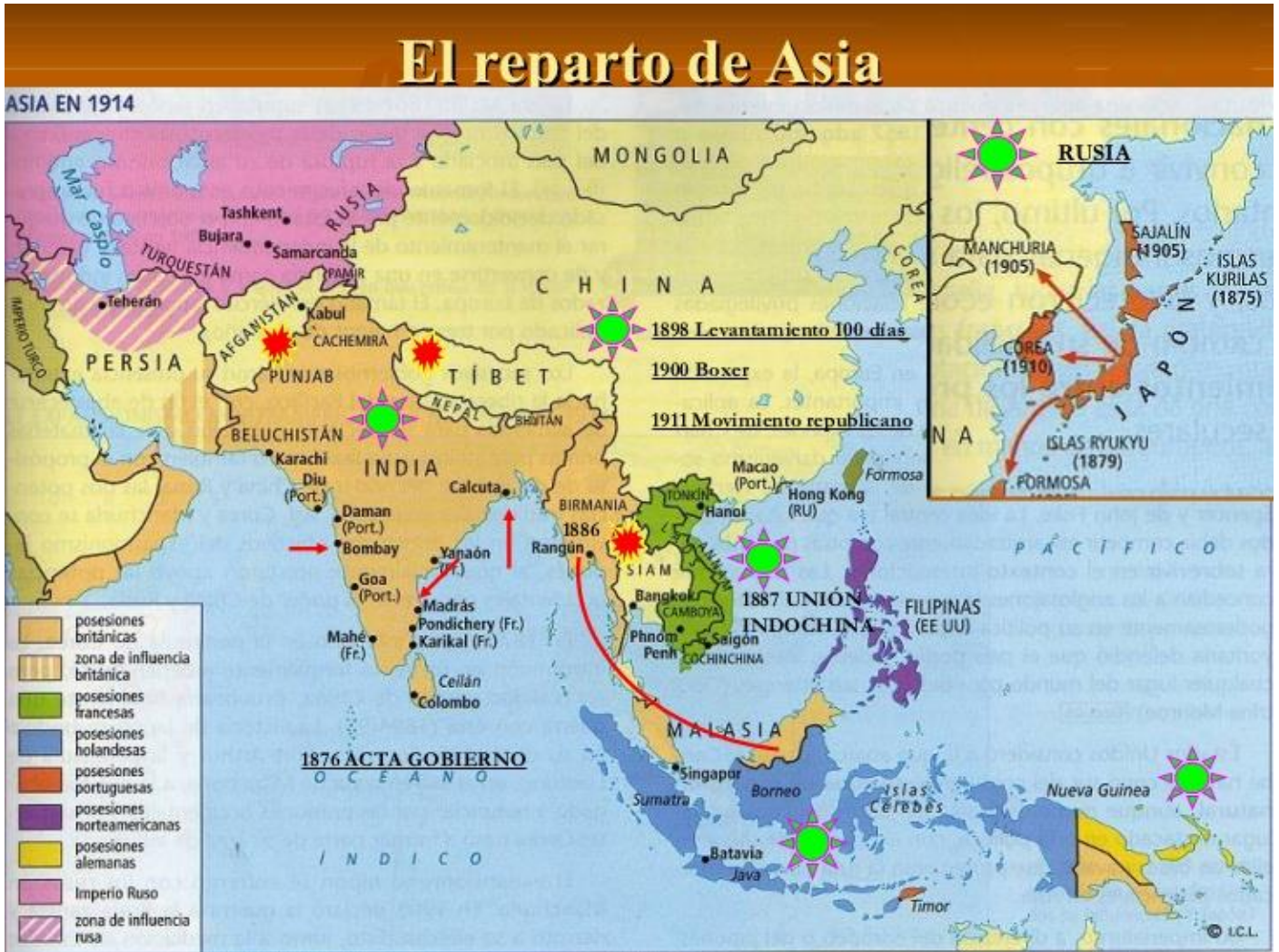
Mapa imperialista mundo